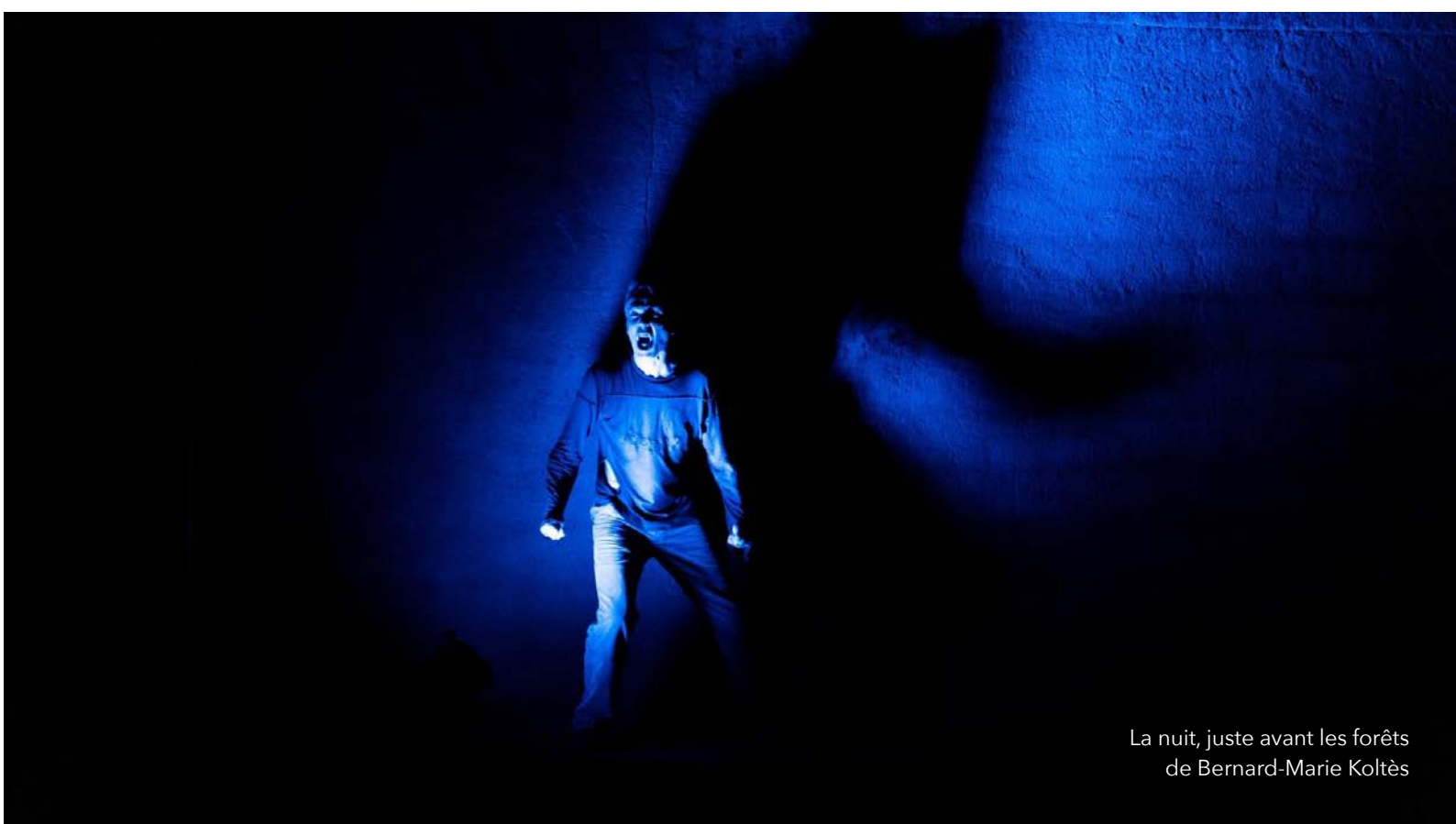
La nuit, juste avant les forêts de Bernard-Marie Koltès